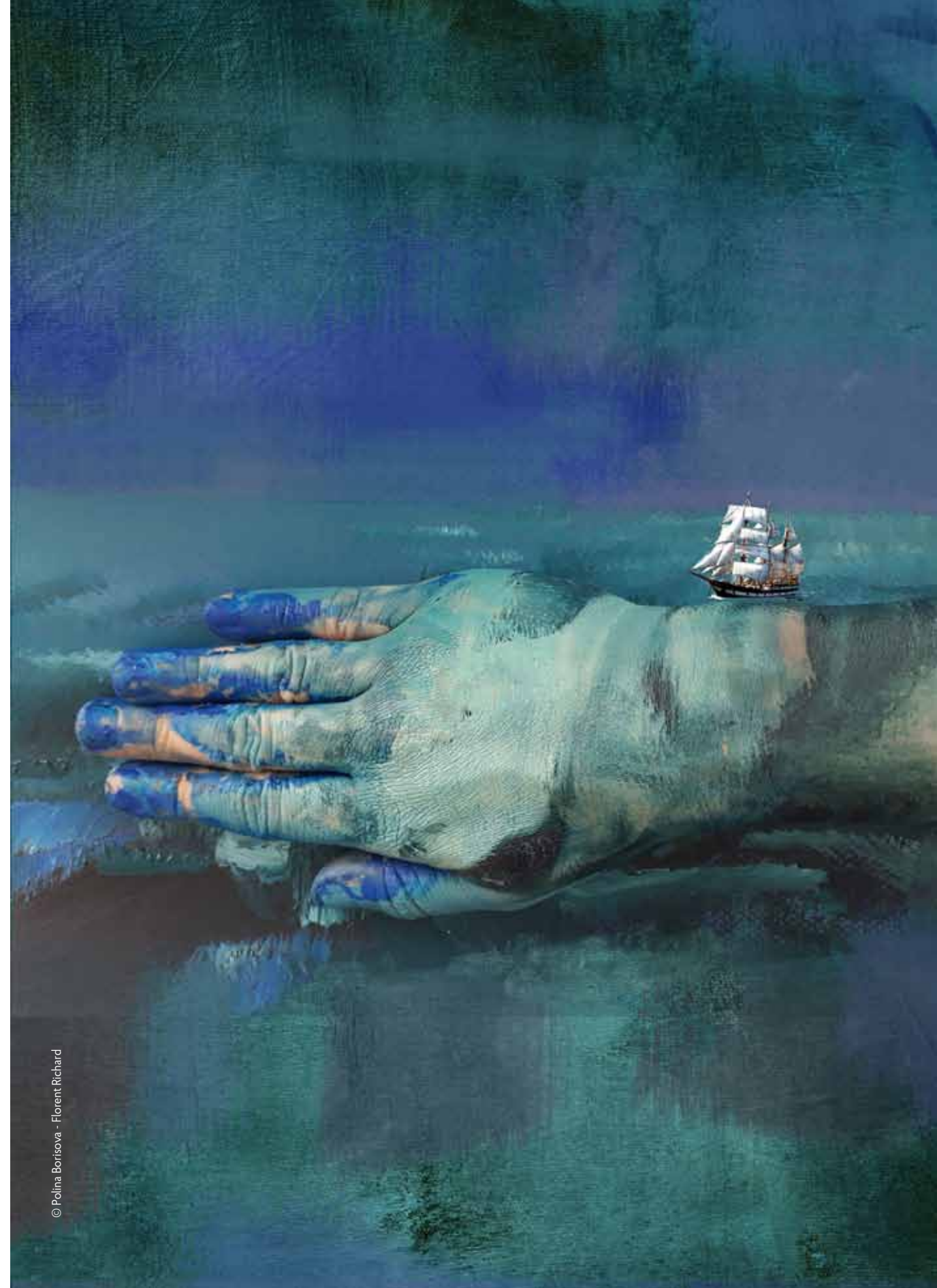
© Polina Borisova - Florent Richard