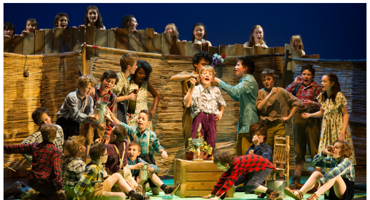
La Guerre des boutons © Yves Petit