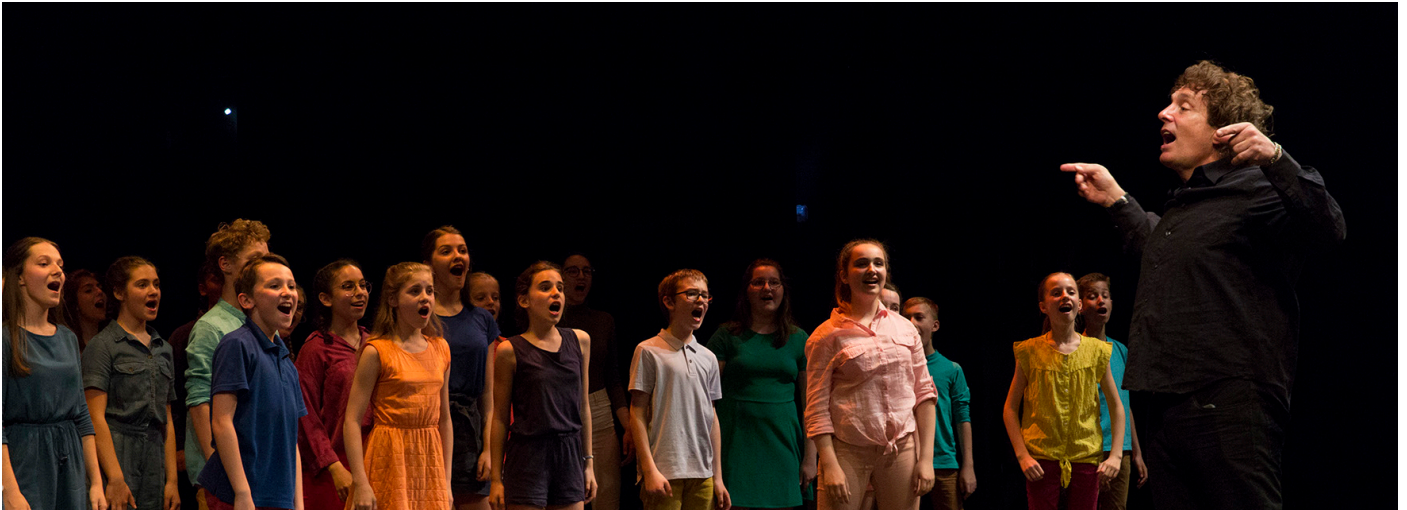
Sililiza : Ecoute !

Jim Papoulis a apporté des contributions significatives à la musique chorale en revitalisant le répertoire choral avec des chansons dont les racines sont classiques et mondiales, Il incorpore des percussions vocales et des rythmes du monde. Il croit fermement que la musique peut guérir, éduquer, célébrer et renforcer +la vie des enfants.