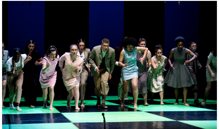
Journal d'un usager de l'espace

Entre trois et cinq créations avec voix d'enfants voient le jour chaque saison.