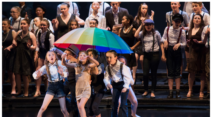
Voyage à New York