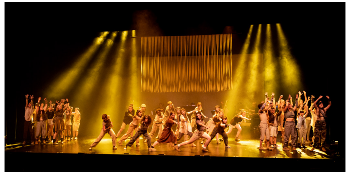
La Marche des enfants 2023