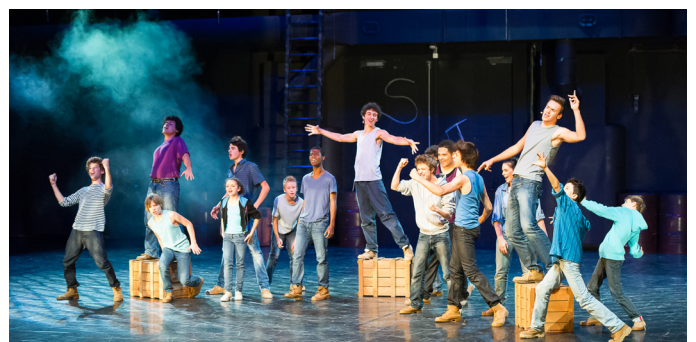
West Side Story