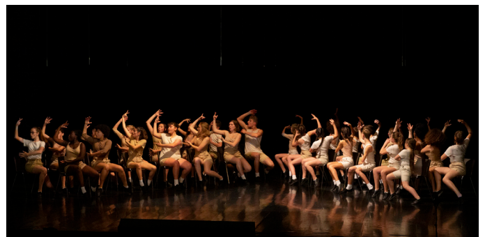
Makil la tribu qui chante