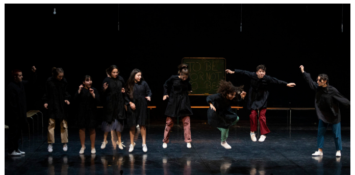
Children of Britten 2022